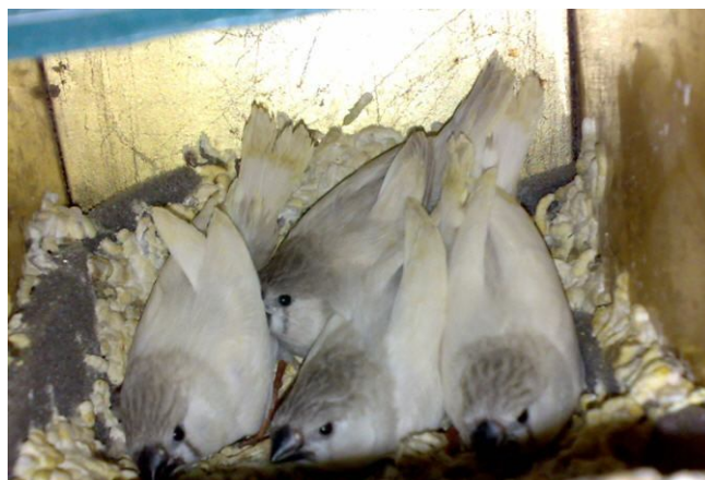
4 جوجه فنچ در لانه گونه ی سفید و زبرا (دورگه)