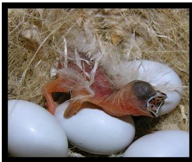
جوجه فنچ تازه متولد شده