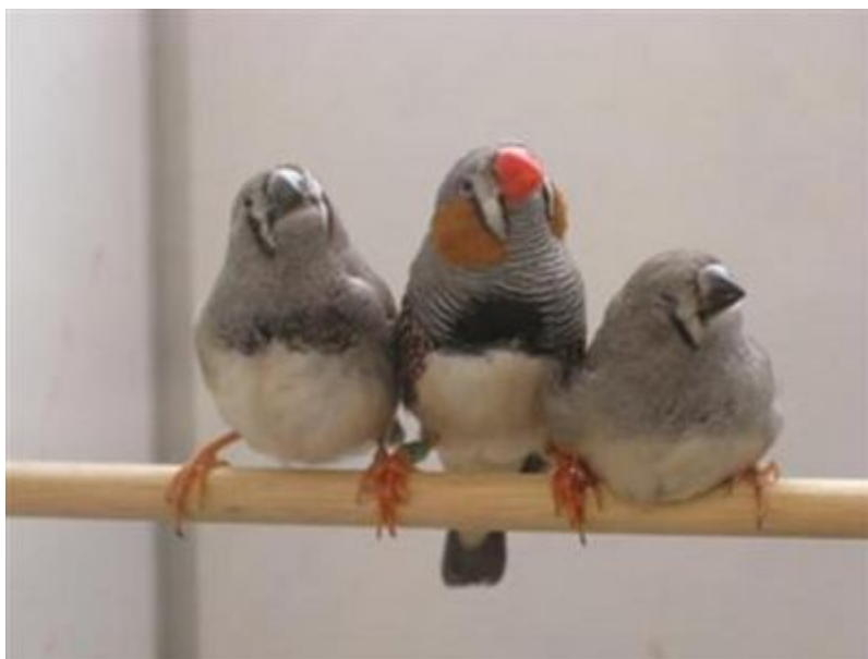
دو جوجه فنچ 2 ماهه در کنار فنچ نر (پدر)(نیازمند غذا از پدر)