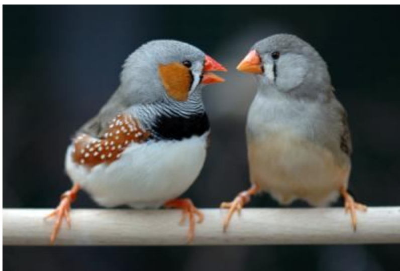
چهره یک فنچ نر برای آغاز جفت گیری