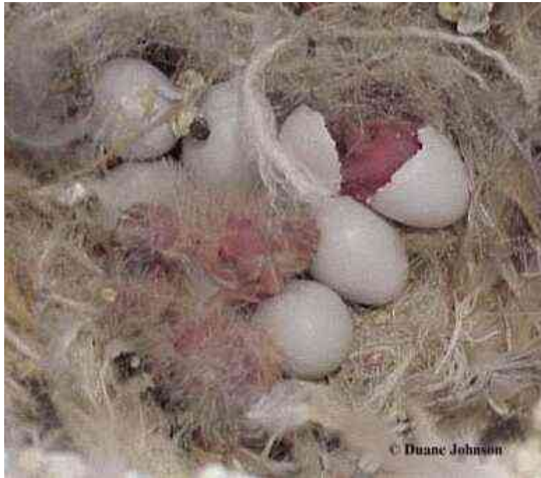
جوجه فنچ ها در حال خارج شدن از تخم