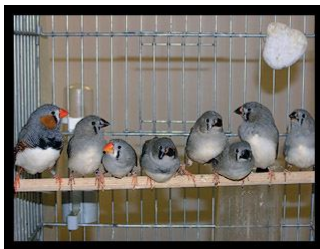
مادر و پدر و 6 جوجه (گونه زبرا)