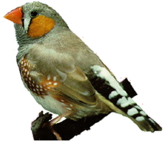
فنج گونه زبرا