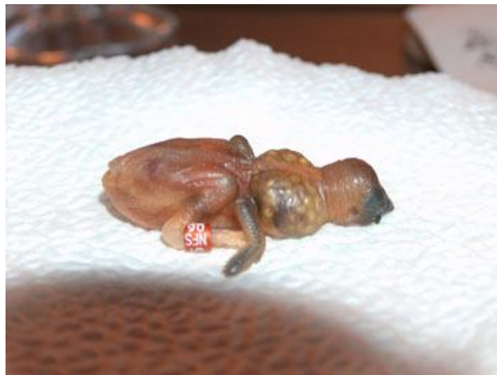
یک جوجه فنچ غذار خورده