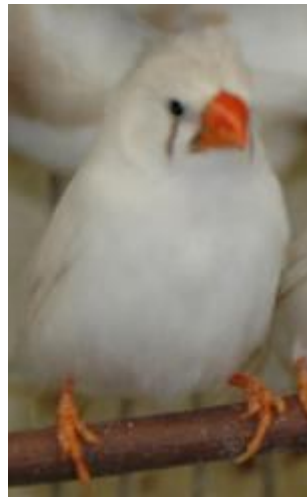
ماده ی سفید