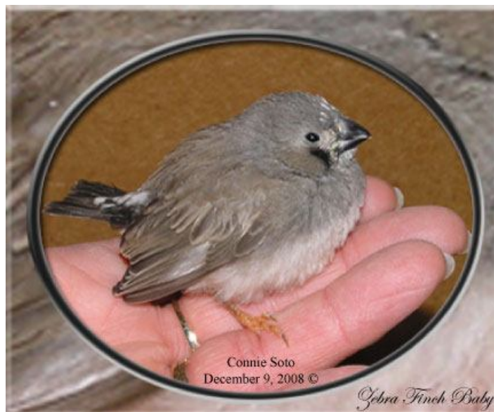
نسبت اندازه یک جوجه فنچ نیازمند غذا در کف دست انسان