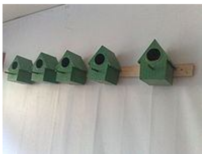
لانه مخصوص فنچ